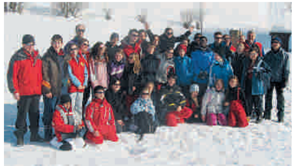
Un'immagine di un'escursione sulla neve dei Cerbiatti del Cai di Olgiate Comasco

I Cerbiatti sono sempre in gran forma E per gli adulti trasferta in Val Trebbia