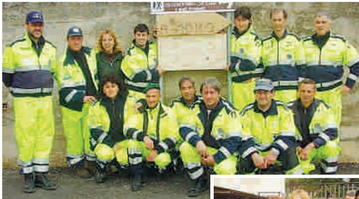
I volontari della Protezione civile e gli abitanti dei paesi abruzzesi

I volontari si sono rimboccati le maniche. «Manuel è un idraulico e si è reso disponibile per allacciare alla